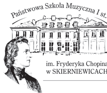
im. Fryderyka Chopina w SKIERNIEWICACH

Zapraszamy kandydatów w wieku od 7 do 16 lat.